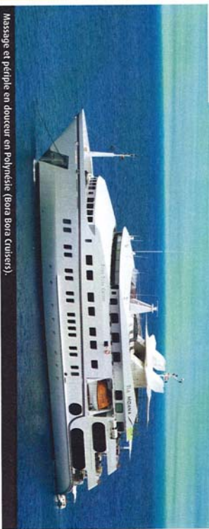
Massage et péripie en douceur en Polynésie (Bora Bora Croisiers).