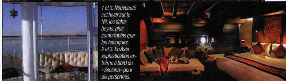
1 et 3. Nouveauté cet hiver sur le Nil: les dahabeyas, plus confortables que les felouques. 2 et 3. En Asie, sophistication extrême à bord du « Silolona » pour dix personnes.